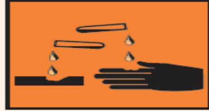
مادة كاوية و حارقة