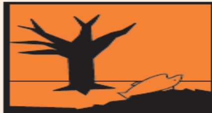
مادة ضارة للبيئة