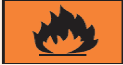
مادة قابلة للاشتعال